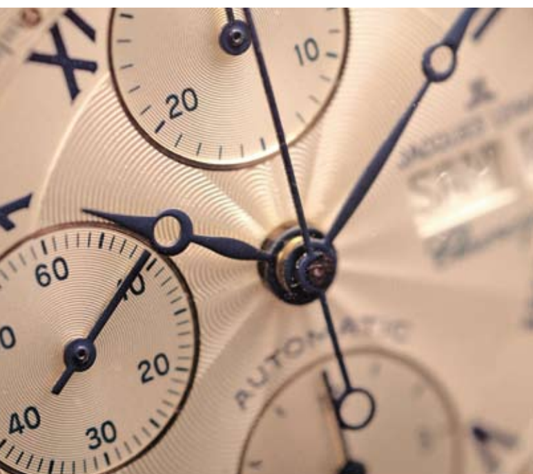
Gli amatori di prelibatezze o gli appassionati di tecnica orologera sanno che dietro a questi prodotti squisitamente svizzeri ci sono conoscenze, tecnica e tradizioni centenarie.

Non avevo mai lavorato alla creazione di francobolli e immaginavo un prodotto ben diverso da quello che è sfociato nella realizzazione finale. Ho sempre pensato ai francobolli come opere in miniatura, con una connotazione classica fatta di texture e filigrane, un prodotto «serio» ed istituzionale. Di grande aiuto per uscire da questa empassè è stata la possibilità di visionare i prodotti filatelici emessi dalle poste svizzere negli anni precedenti e constatare che si poteva affrontare il tema anche con una buona dose di ironia.