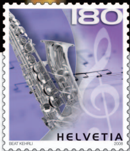
Musica jazz (sassofono)