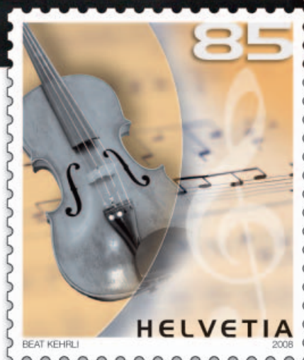
Musica classica (violino)

Un violino, una fisarmonica svizzera, una chitarra elettrica ed un sassofono: sono i quattro strumenti riprodotti sulla nostra nuova serie di dentelli dedicati a quattro stili musicali diffusi in tutto il mondo: la musica classica, quella popolare, la musica rock/pop ed il jazz. Mentre la musica popolare resta più saldamente impiantata a livello locale, i tre altri stili sono diventati vere e proprie categorie dell'industria musicale internazionale, ascoltate dalla Corea agli Stati Uniti o alla Finlandia.