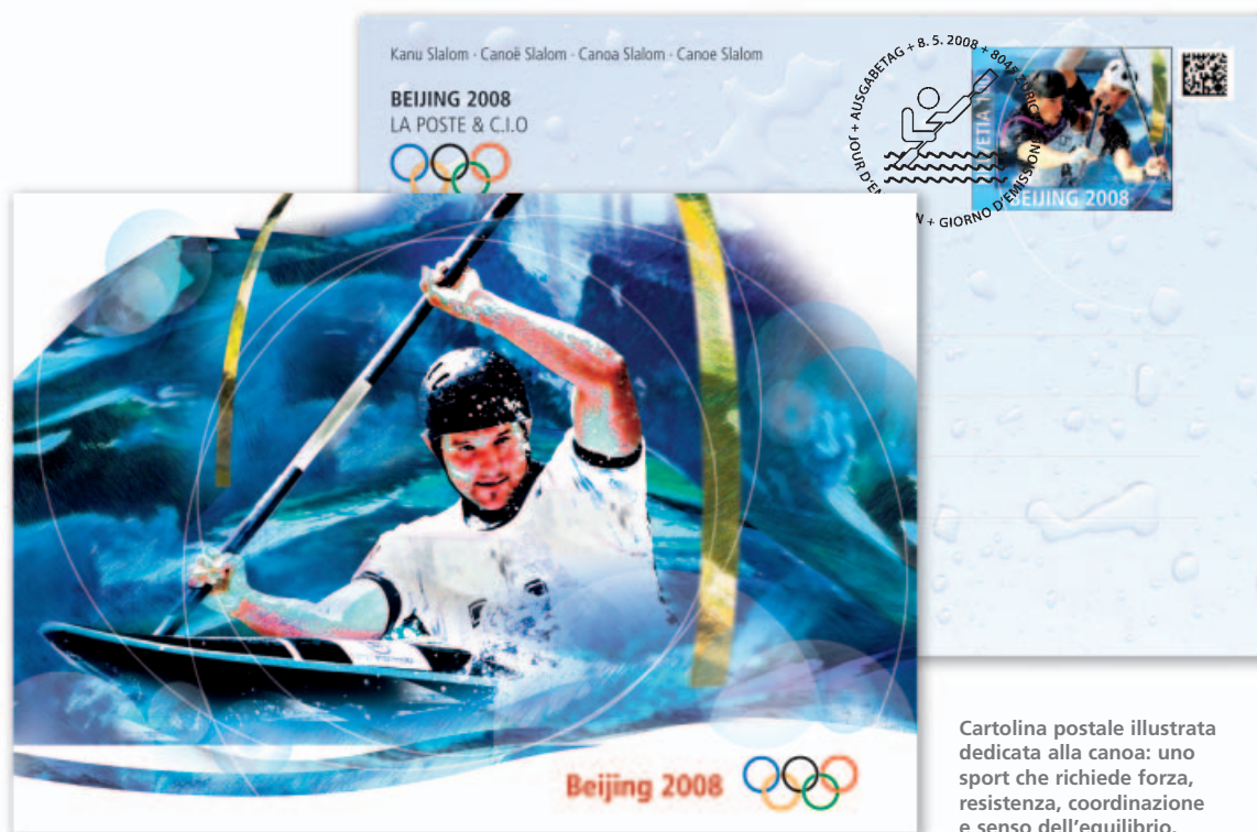
Cartolina postale illustrata dedicata alla canoa: uno sport che richiede forza, resistenza, coordinazione e senso dell'equilibrio.

→ viaggiare, pescare e cacciare. In occasione delle Olimpiadi di Pechino 2008 questa disciplina impreziosisce una cartolina postale illustrata.