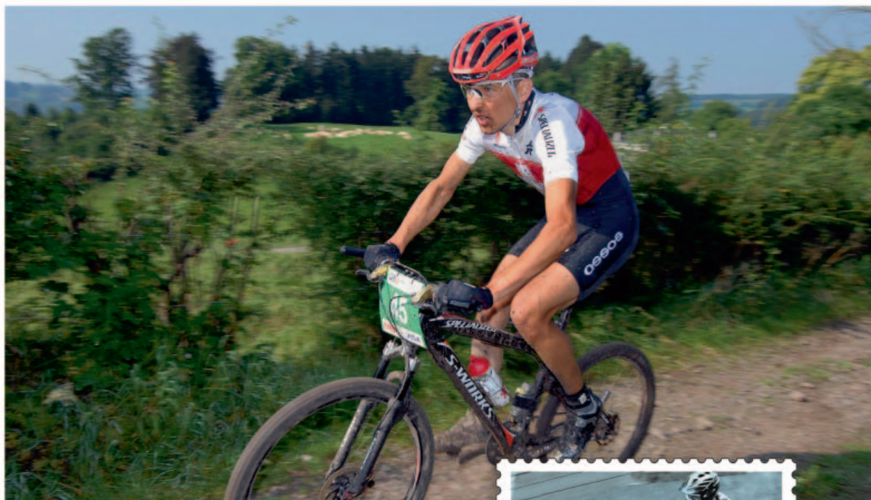
Da anni uno dei grandi campioni del mountainbike, vincitore del bronzo alle Olimpiadi di Sydney: il bernese Christoph Sauser.

BMX, mountainbike, canoa: due giovani discipline e uno sport antichissimo nel programma delle Olimpiadi estive di Pechino 2008. La Posta Svizzera rende omaggio a queste specialità con due francobolli e una cartolina postale illustrata.