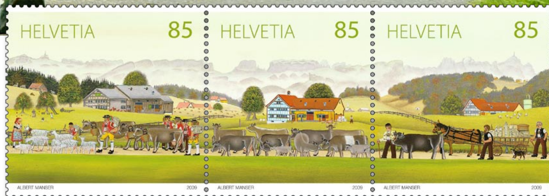
La regina della mandria