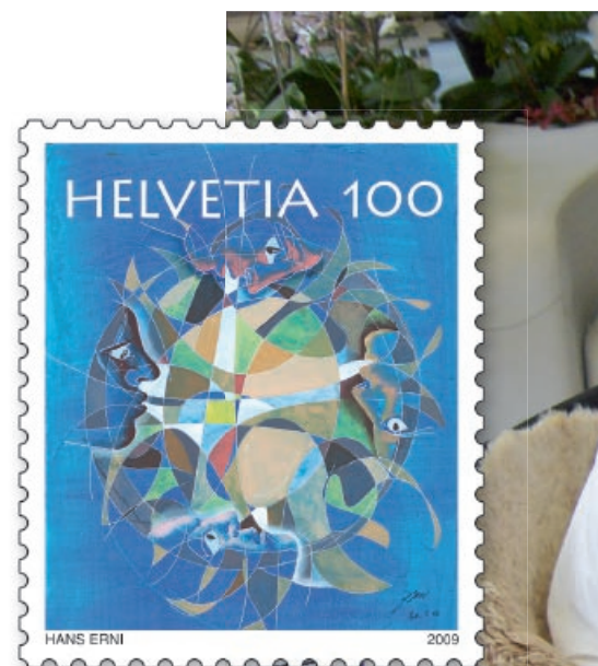
Francobollo speciale e minifoglio «La menta humana»

Quando Hans Erni disegna, dipinge o scrive, delle arie di musica classica risuonano nella stanza. In questo momento