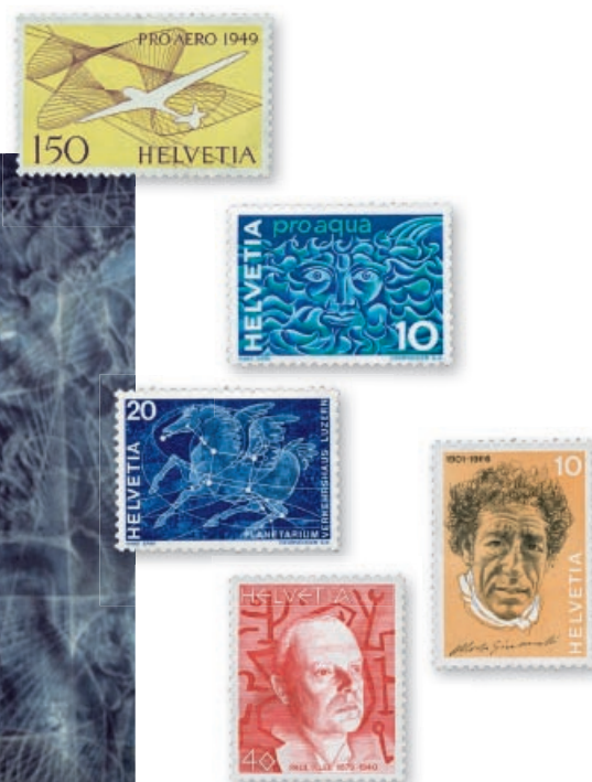
Hans Erni nel suo atelier nel 1969: nel complesso ha creato ben 90 francobolli. Il suo primo dentello svizzero – un segno di valore Pro-Aero – fu emesso nel 1949.