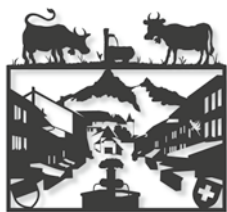
Motivo su busta primo giorno