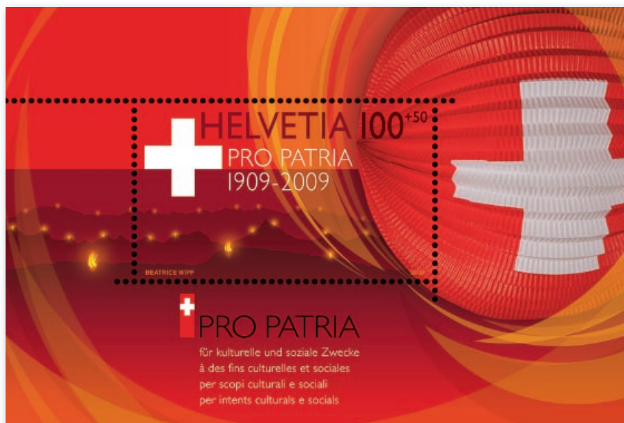
Blocco speciale «Centenario Pro Patria»