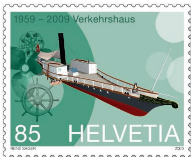
Battello a vapore Rigi

Il Museo Svizzero dei Trasporti è un il luogo delle mille scoperte, divertente e ludico, nel quale figurano anche i testimoni originali della storia dei trasporti. Inaugurato nel 1959, è il museo più visitato della Svizzera, grazie ai suoi 870 000 visitatori all'anno. In occasione del suo cinquantesimo anniversario, il museo propone nuove attrazioni e la Posta gli dedica tre francobolli speciali.