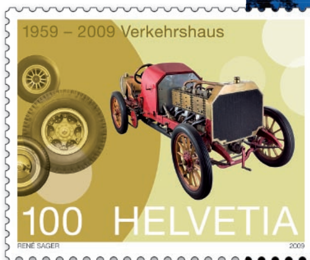
Macchina da corsa Dufaux

Nel 2009 il Museo dei Trasporti celebra il suo cinquantesimo anniversario e propone un gran numero di nuove attrazioni. Prima delle celebrazioni, vari edifici facenti parte del complesso verranno rinnovati o ristrutturati. Il nuovo ingresso del complesso – il FutureCom – è già stato inaugurato nel novembre del 2008. Esso comprende la «Media Factory», dedicata alla scoperta interattiva del mondo della comunicazione, e il nuovissimo centro congressuale. Anche altre sezioni del museo propongono nuove esposizioni e programmi in anteprima. In occasione dell'anniversario ufficiale del museo, a fine giugno 2009, verranno inaugurati anche una nuova hall dedicata ai trasporti urbani nonché uno spazio multifunzionale all'aperto per le esposizioni temporanee.