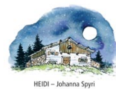
HEIDI – Johanna Spyri