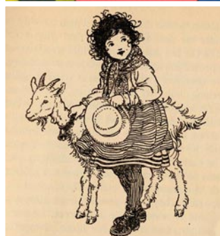
Sette immagini d Heidi, tutte diverse: spetta comunque alla fantasia del lettore immaginare il volto di questa eroina dei paesaggi alpestri. Illustrazioni: zvg