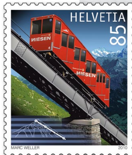
Minifoglio ferrovia del Niesen