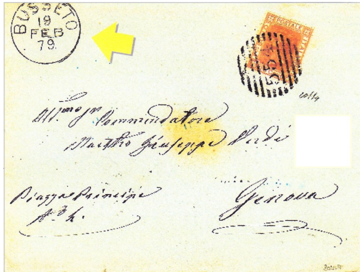
Giuseppe Verdi nacque a Busseto, in provincia di Parma, nel 1813

In una collezione su Verdi non c'è altro modo di ricordare Busseto, luogo di nascita del maestro, senza dover fare alcun riferimento all'indirizzo.