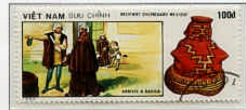
Arrivo di Colombo al convento di "La Rabida"