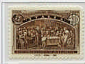
Colombo sollecita un'aiuto alla Regina Isabella