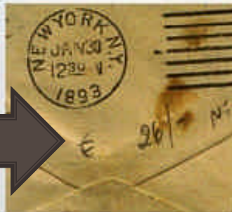
Retro della busta con annullo